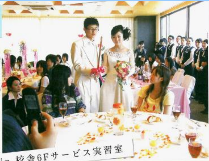
in 校舎6Fサービス実習室